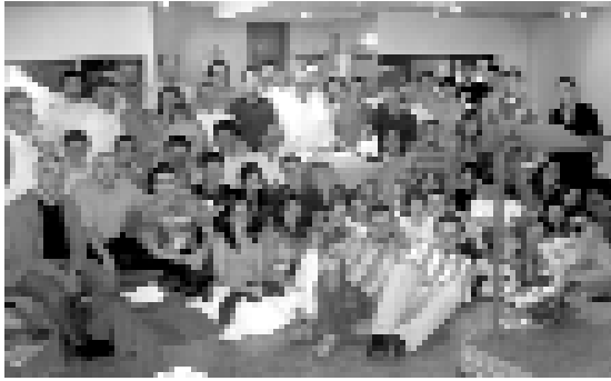
Celebración por incorporación de nuevos miembros en Cdad de Gijón)

La espiritualidad del Seglar Claretiano será el tema de reflexión de la VII Asamblea General del Movimiento. Sin embargo, en el documento final de la asamblea del año 2003, ya se incluyeron algunos numerales sobre este tema, que voy a recordar para que tengamos una visión más completa de la reflexión sobre la espiritualidad mantenida hasta el presente en el Movimiento.