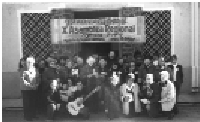
Asamblea Regional de Argentina-Uruguay

Para entrar en sintonía con el tema de la "Espiritualidad Claretiana", podemos recordar lo que nos indica el Ideario sobre la "Espiritualidad" (nn 28 - 40) y la ampliación del Comentario al Ideario (pg 211-278); en lo posible, llevemos esta reflexión a la oración personal y comunitaria.