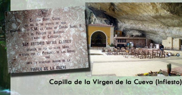
Capilla de la Virgen de la Cueva (Infiesto)