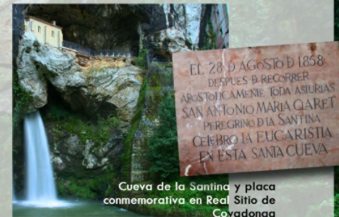
Cueva de la Santina y placa conmemorativa en Real Sitio de Covadonga

Tras este viaje, Antonio María Claret funda la Academia de San Miguel, a través de la cual se difundieron gratuitamente numerosos libros”.