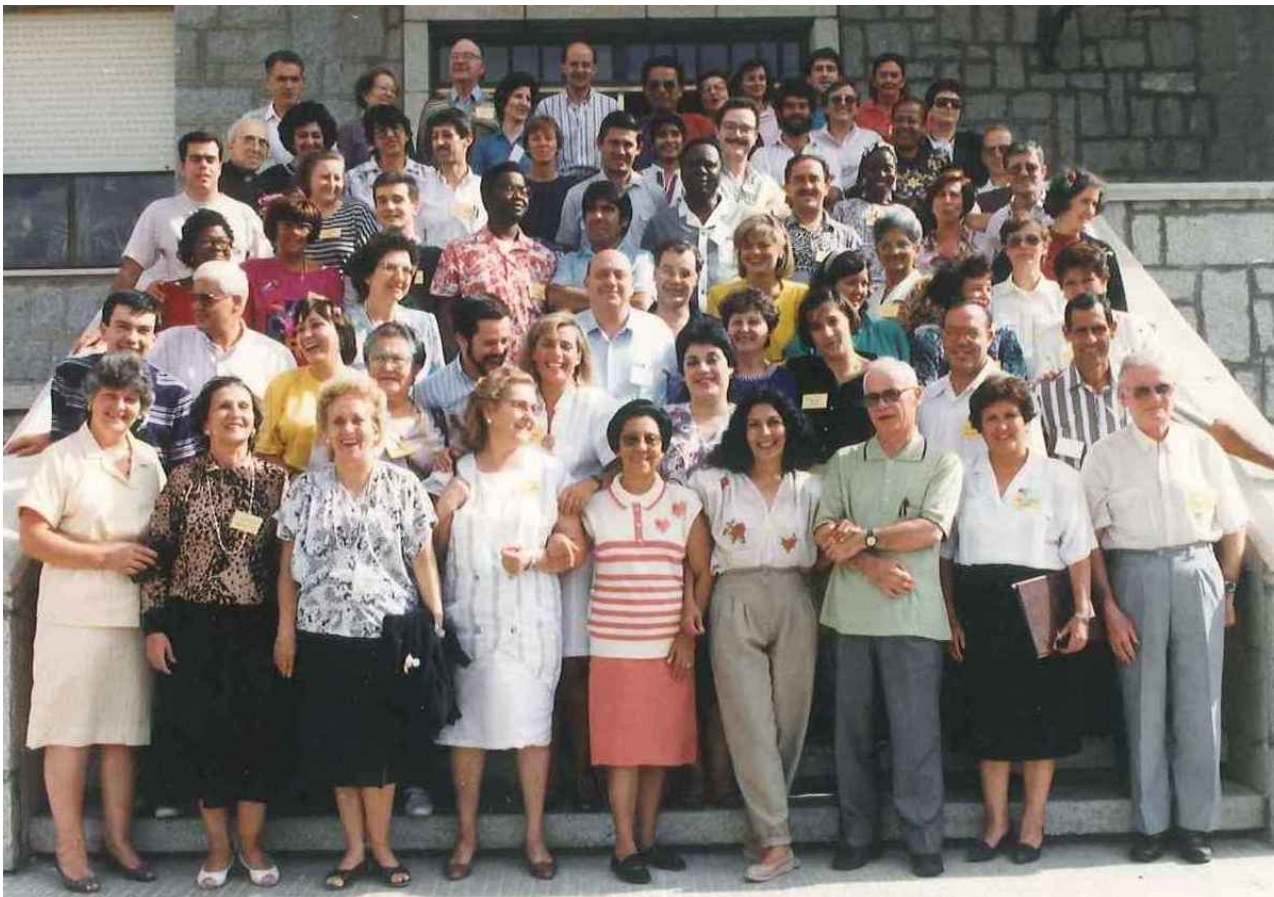
Foto de los participantes en la Asamblea