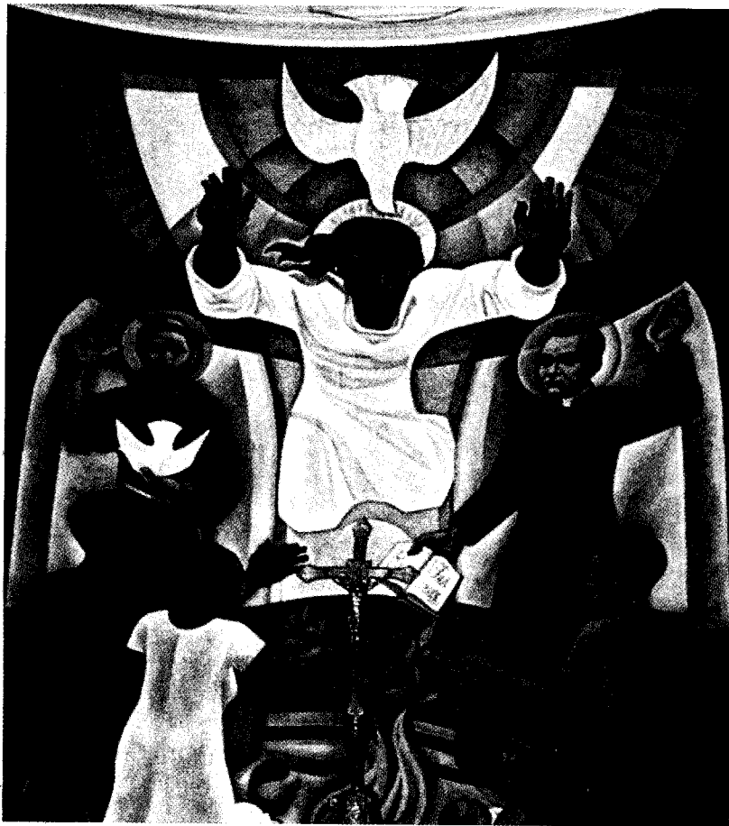
Detalle del mural de la catedral de Quibdó (Colombia)

Vive en comunión con otras personas que tienen también a Claret como punto de referencia y forma con ellas el Movimiento de Seglares Claretianos y la Familia Claretiana.