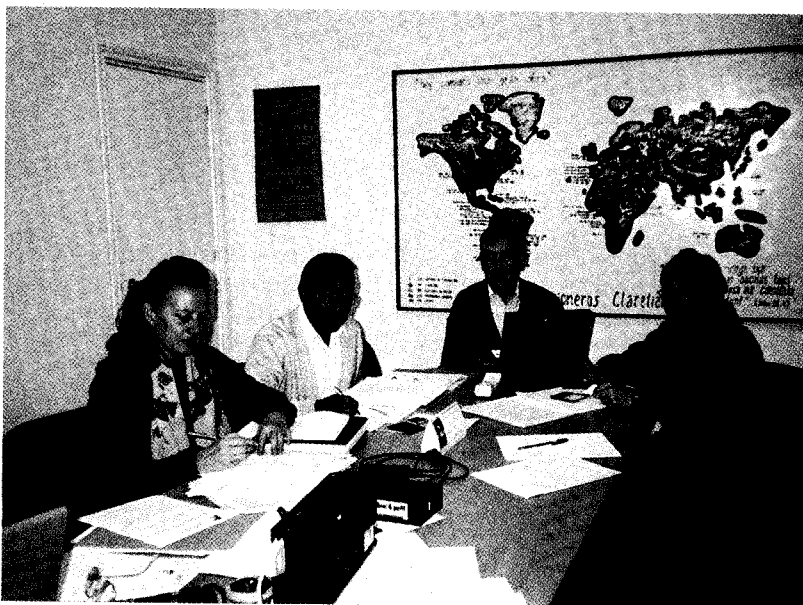
Miembros del Actual Consejo General de los SC

Los actuales grupos de Seglares Claretianos de Altamura de la Región de Italia, ahondan sus raíces en los primeros Colaboradores Claretianos surgidos en Altamura con la llegada de los Misioneros Claretianos a esta ciudad en 1936. Su realidad, por tanto, esta construida desde la continuidad con el pasado y, al mismo tiempo, desde la atención al presente. La continuidad con el pasado se manifiesta en su empeño por seguir colaborando en el sostenimiento de las misiones claretianas de Gabón y su inserción en el presente se refleja, sobre todo, aunque