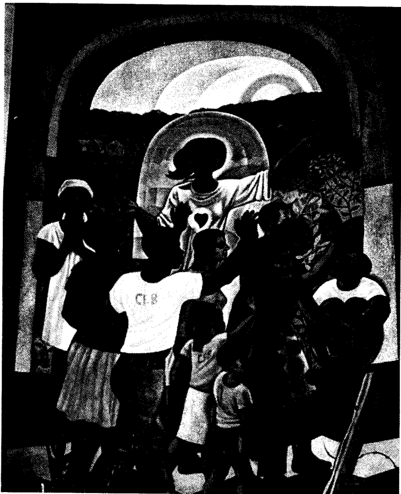
María acompaña la misión. Detalle del mural de la catedral de Quibdó (Colombia)

Se siente ayudado por San Antonio María Claret, en quien ve encarnados de manera excepcional el carisma y la misión a la que él se siente llamado.