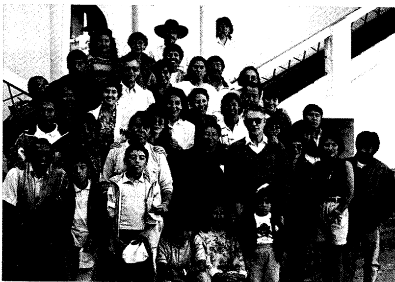
Asamblea de la Región de Bolivia

Extendido por más de 20 países de Europa, América, África y Asia, sus tareas apostólicas responden al deseo de transmitir la Buena Nueva acudiendo a lo más urgente, oportuno y eficaz. Dedican sus energías a promover agentes de evangelización, en formarlos debidamente, en crear y acompañar comunidades cristianas. Sus plataformas de evangelización abarcan: la educación cristiana, la pastoral parroquial, tareas diocesanas e inter diocesanas, la formación teológica y distintas obras sociales.