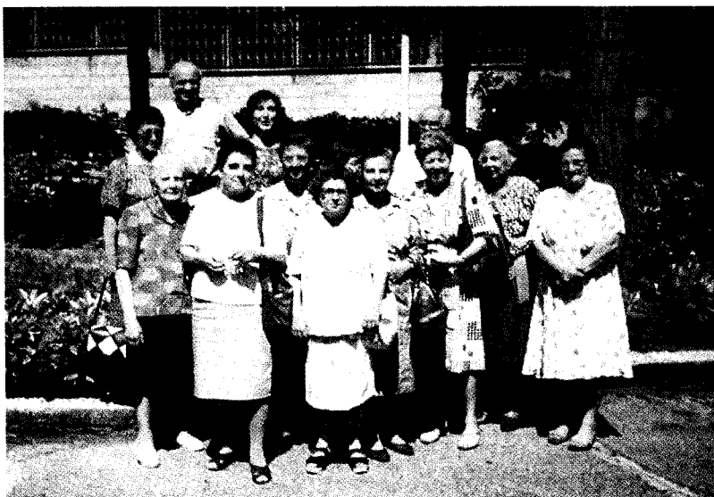
Asamblea Región de Italia