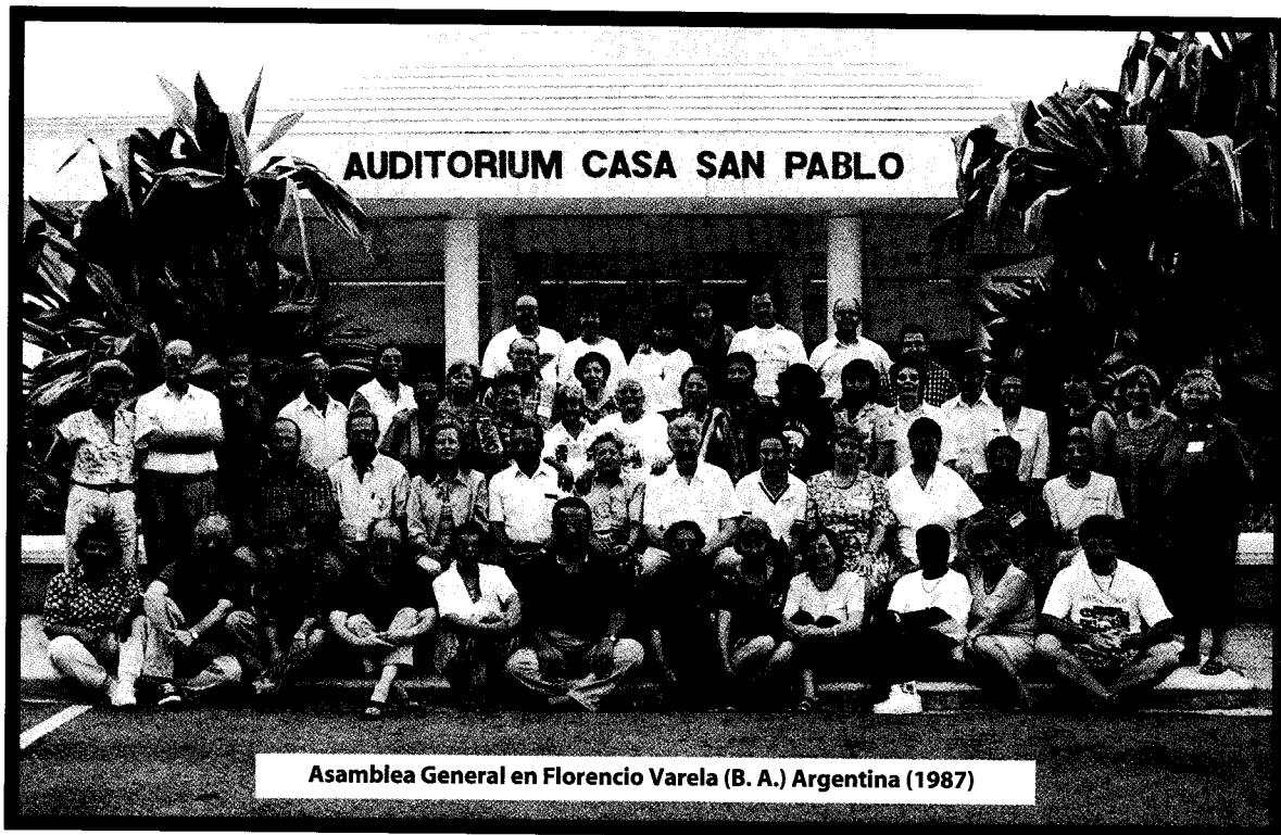
Asamblea General en Florencio Varela (B. A.) Argentina (1987)