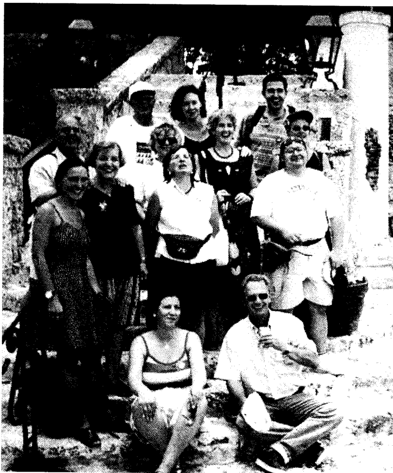
La organización interna es muy descentralizada y democrática

Todos estamos llamados a ser coherentes y a dar testimonio cristiano en la familia, entre los vecinos, en el trabajo, entre las amistades, en la parroquia o comunidad cristiana y entre los compañeros de compromiso social.