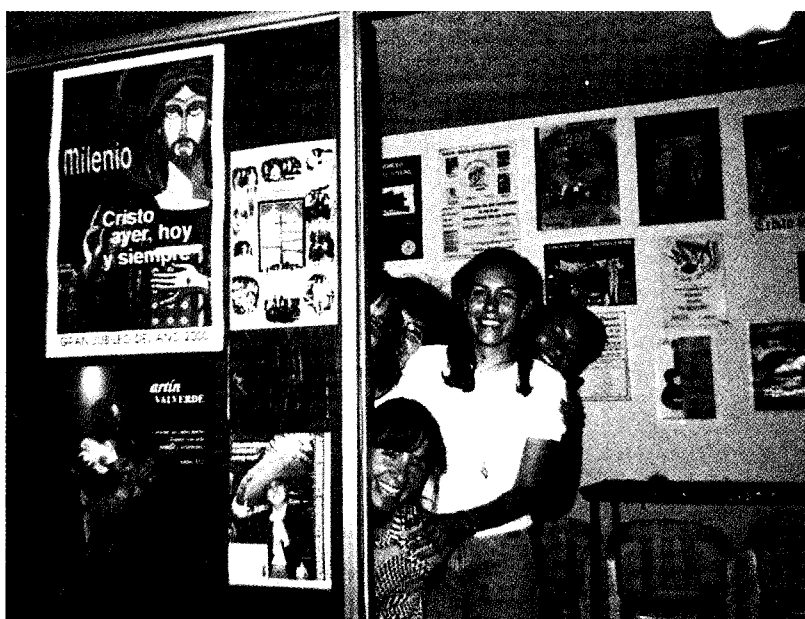
Taller de artes gráficas (Morelia-México)

La mayoría de sus miembros han realizado estudios universitarios y ejercen profesiones relacionadas con sus estudios. También participan en las actividades de la parroquia del lugar en que viven.